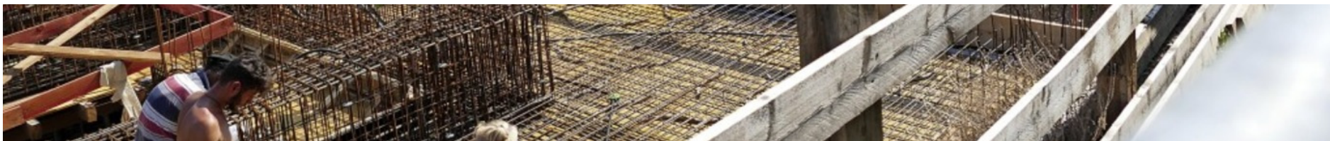
Beim vorderen Haus ist der Tiefgaragen-Rohbau quasi fertig, sodass bald die Arbeiten am Erdgeschoss starten.

. Es ist die größte und wichtigste Baustelle in Bad Krozingen. Entlang der Basler Straße bei Rathaus und Kirche St. Alban soll nichts weniger entstehen als das neue Zentrum der Stadt, mit Wohnungen, Einzelhandel, Gastronomie und attraktivem Außenbereich . Nach dem Abschluss der aufwändigen archäologischen Arbeiten kommt der Bau der drei Gebäude, auch trotz Corona, gut voran. Die Planung sieht vor, dass das Areal bis 2022 fertiggestellt wird. Derweil wurde auch bekannt, dass das Bleile-Haus Anfang 2021 abgerissen werden soll.